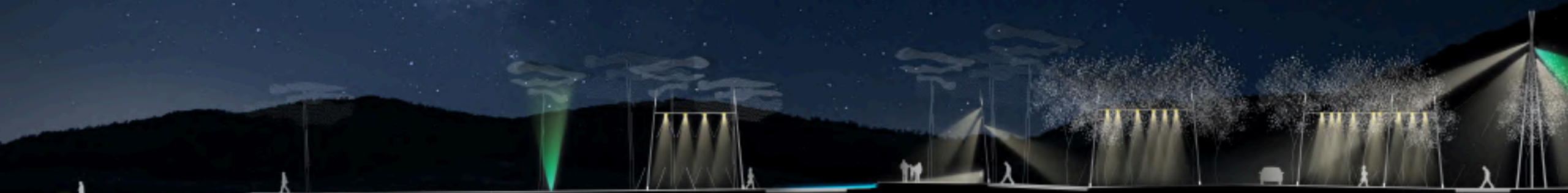
TYPE E1 ENCASTRÉ DE SOL ECLAIRAGE VÉGÉTAL